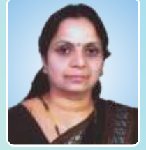
सौ. कुंदा दि. गुरव